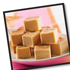
SUCRE À LA CRÈME