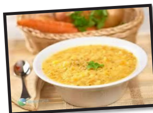
SOUPE AUX POIS