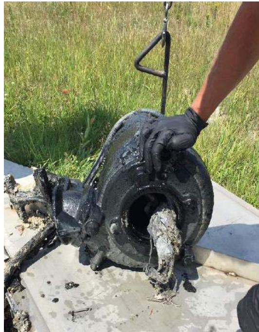
Travaux publics a été chargé de débrancher une zone spécifique du réseau d'égouts où un gros chiffon a été récupéré.

Municipalité rurale de / Rural Municipality of La Broquerie